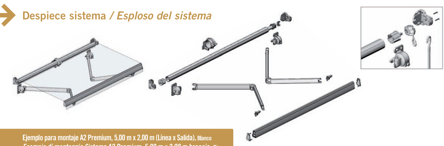
Ejemplo para montaje A2 Premium, 5,00 m x 2,00 m (Línea x Salida). Blanco Esempio di montaggio Sistema A2 Premium, 5,00 m x 2,00 m braccio. Bianco