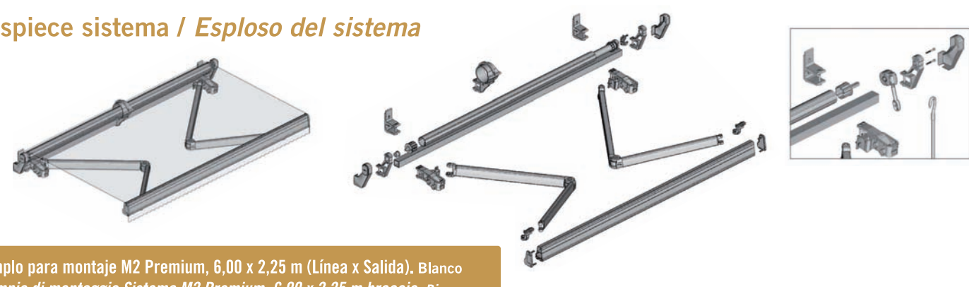
Ejemplo para montaje M2 Premium, 6,00 x 2,25 m (Línea x Salida). Blanco Esempio di montaggio Sistema M2 Premium, 6,00 x 2,25 m braccio. Bianco