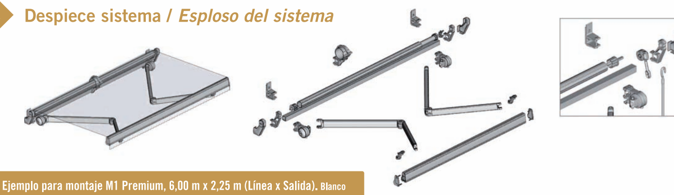
Ejemplo para montaje M1 Premium, 6,00 m x 2,25 m (Línea x Salida). Blanco Esempio di montaggio Sistema M2 Premium, 6,00 x 2,25 m braccio. Bianco